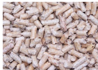
Drei verschiedene Formen des Energieträgers Holz: Scheitholz, Hackschnitzel und Pellets